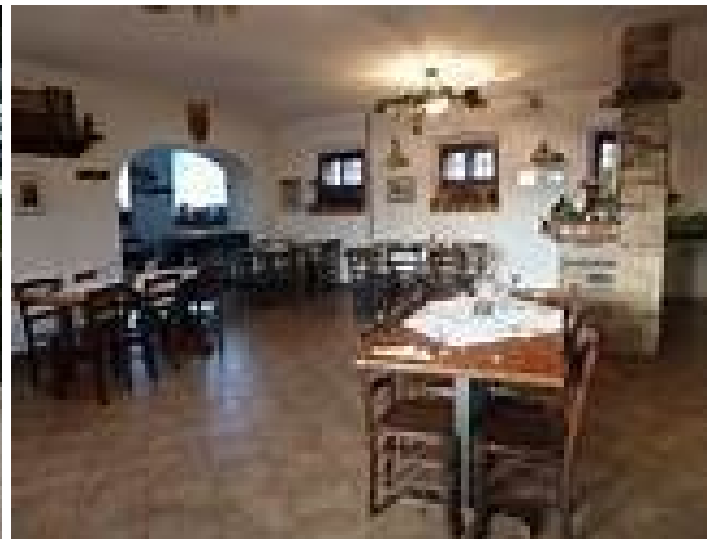
AGRITURISMO MARUSIC - LOKVICA