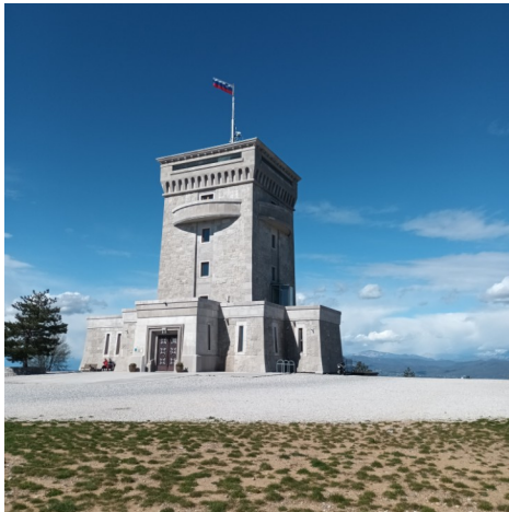
Torre della pace di Cerje