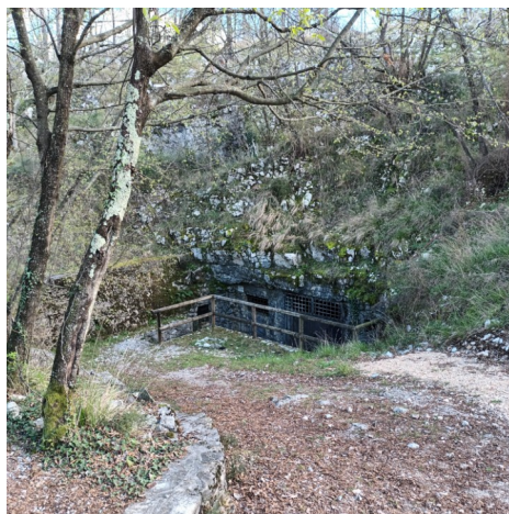
ingresso caverna Pecinka